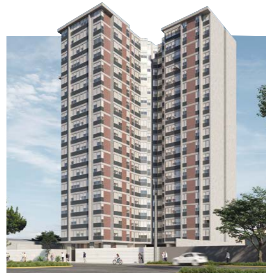
CERCADO DE LIMA

GRAN PARQUE ROMA CERCADO DE LIMA ENTREGADO