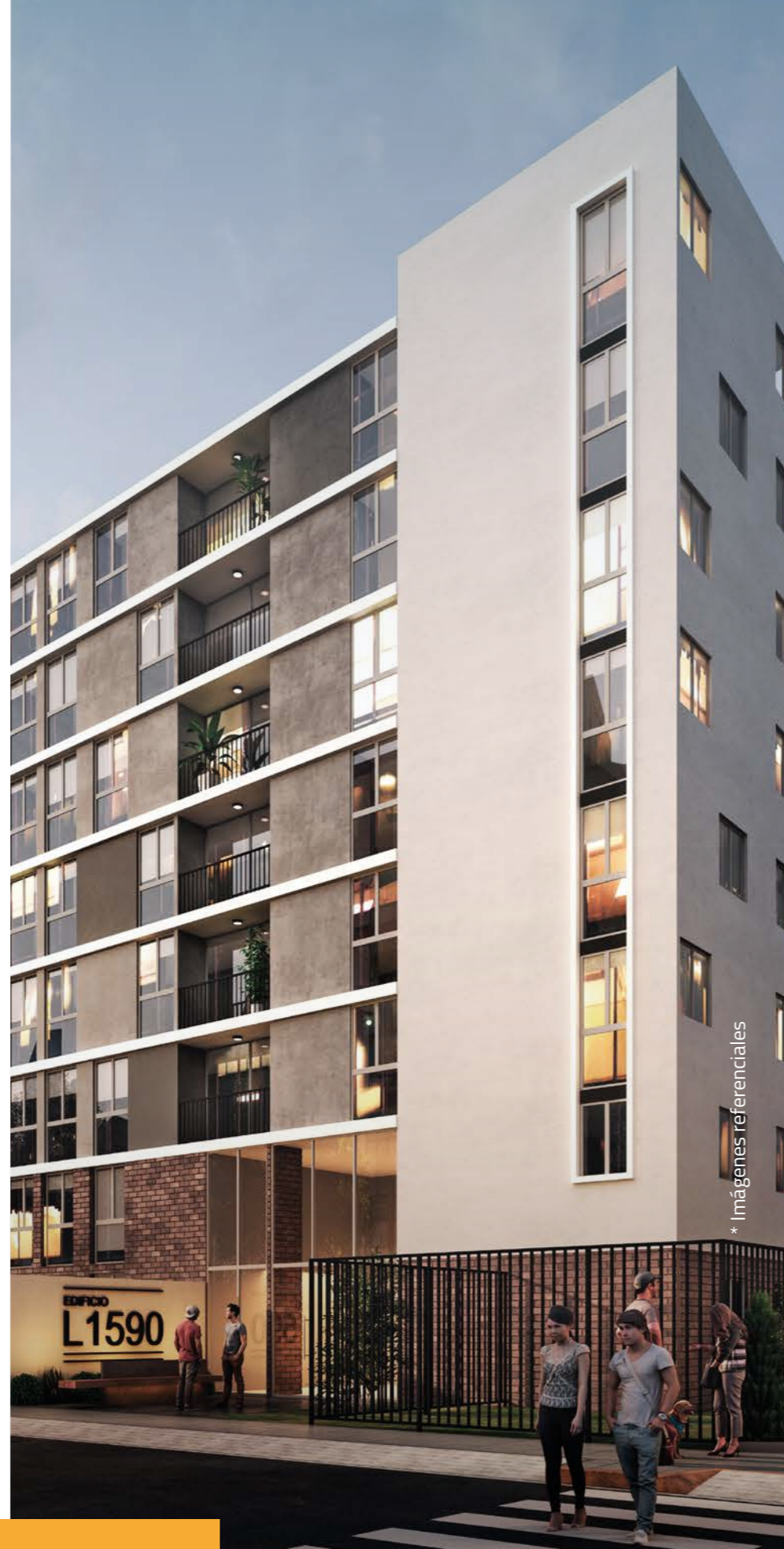
* Imágenes referenciales