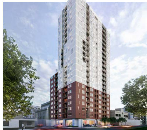
CERCADO DE LIMA

MIRADOR DEL GOLF LIMA ESTE - ÑAÑA ENTREGADO