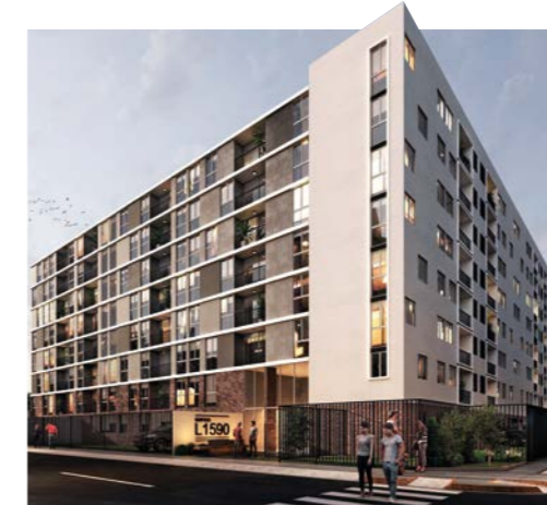
BREÑA - PUEBLO LIBRE