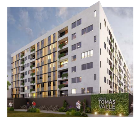
SAN MARTÍN DE PORRES